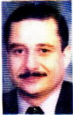
ا. شريف شوقي

السلسلة الوحيدة التي لا يجد الأب أو الأم حرجاً من وجودها بالمنزل